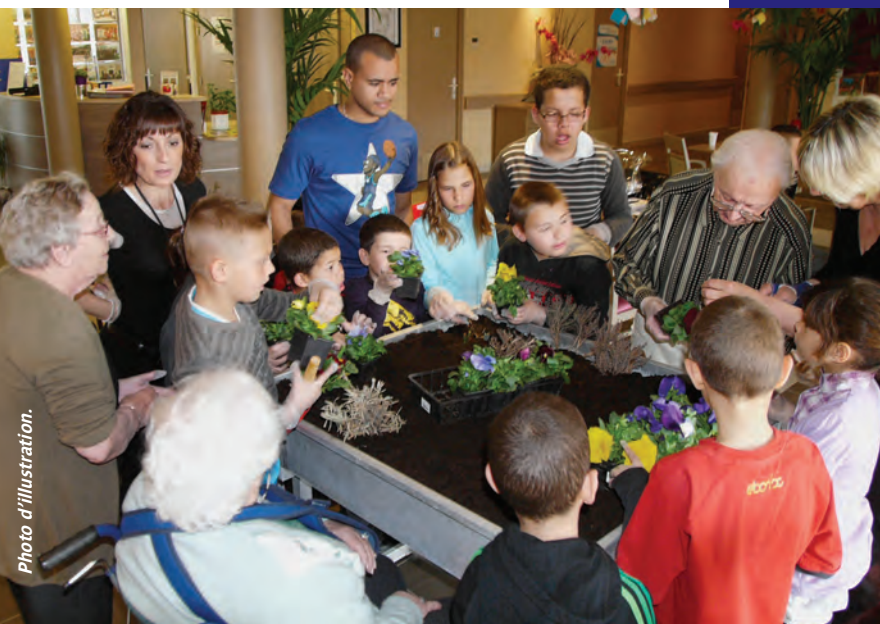
Des rencontres intergénérationnelles vont se dérouler durant la semaine bleue.

Voyage sur la journée avec visite des cafés Chapuis, déjeuner croisière à Saint-Victor, visite de la Chartreuse à Sainte-Croix-en-Jarez, départ à 7 h 45.