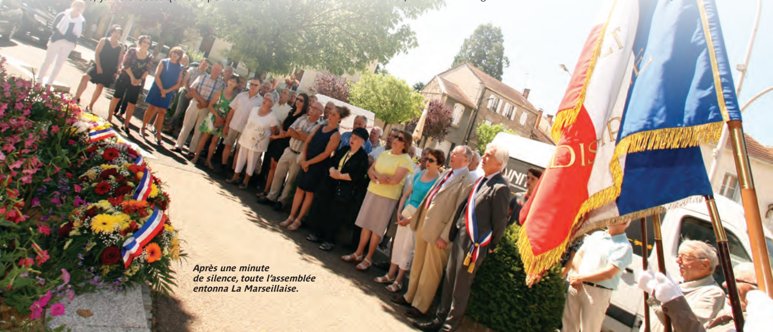
Après une minute de silence, toute l'assemblée entonna La Marseillaise.