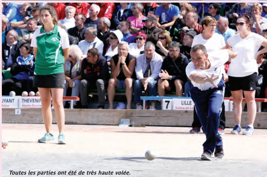
Toutes les parties ont été de très haute volée.