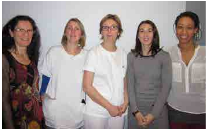
Les équipes du CSAPA du centre hospitalier du Forez.