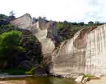
Les ruines du barrage de Malpasset à Fréjus, dans le Var.