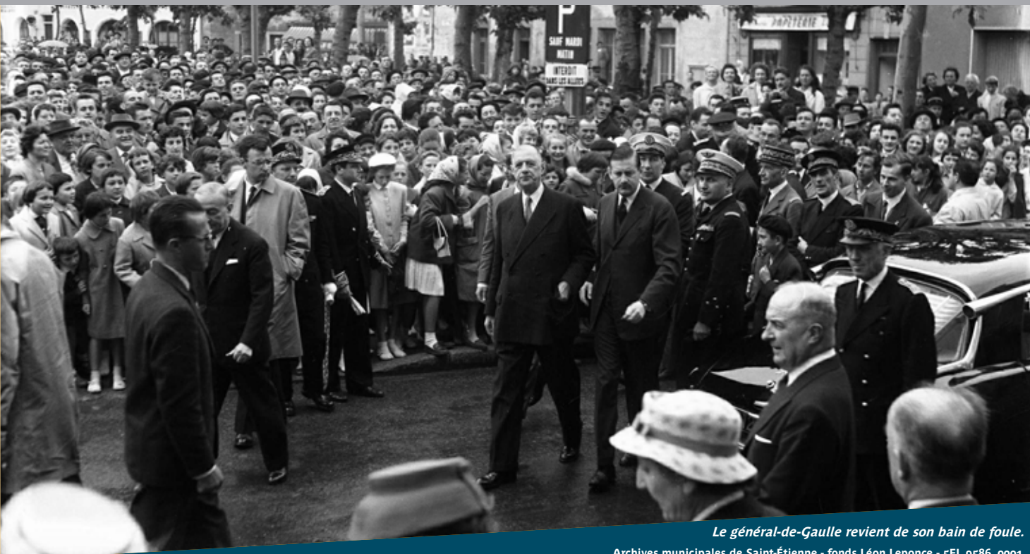
Le général-de-Gaulle revient de son bain de foule.

Archives municipales de Saint-Étienne - fonds Léon Leponce - 5FI_9586_0001