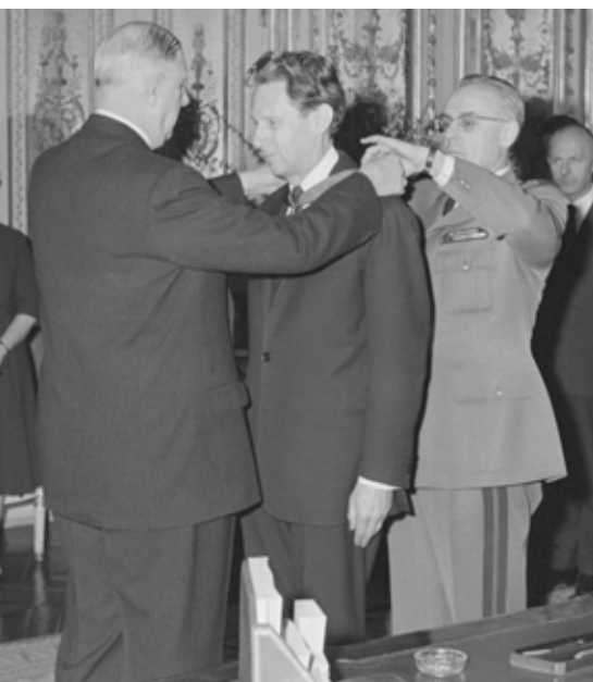
Le général-de-Gaulle remet une décoration – la cravate de commandeur dans l'un des deux grands Ordres nationaux – à René-Brouillet alors ambassadeur de France en Autriche. C'était en 1962 dans un de salons du palais de l'Élysée.