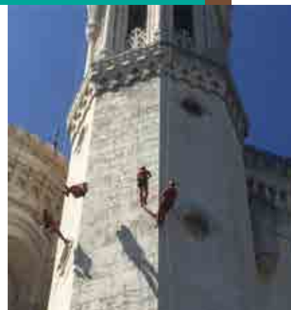
Lors de l'arrivée à Fourvière.