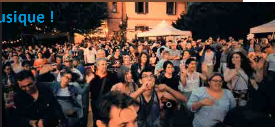
La foule à la tombée de la nuit, lors d'une précédente édition de la fête de la musique dans les jardins du château du Rozier.

• Vendredi 21 juin, à partir de 18 h 30, château du Rozier. Entrée gratuite.