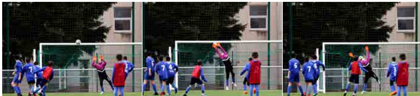
Malgré la détermination de la jeune gardienne de l'USF, elle ne parviendra pas à repousser le tir.

• Site internet : www.us-feurs.com/equipes/forezcup-36.html : Facebook, Twitter et Instagram : Forezcup