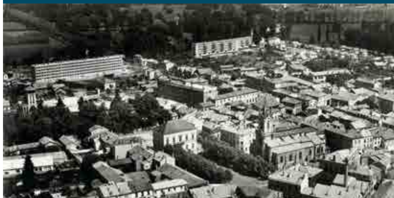
Vue aérienne de Feurs datant de la fin des années 50 ou du tout début des années 60 avec en haut à gauche du cliché les HLM du Montal.

Projet de création d'une rue (N.D.A. : le boulevard Raymond-Poincaré) et construction d'un groupe HLM [N.D.A. : HLM du Montal].