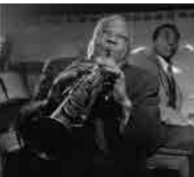
Sidney-Bechet au Jimmy Ryan's club à New-York en juin 1947.

Début des travaux de percement du tunnel du Mont-Blanc.