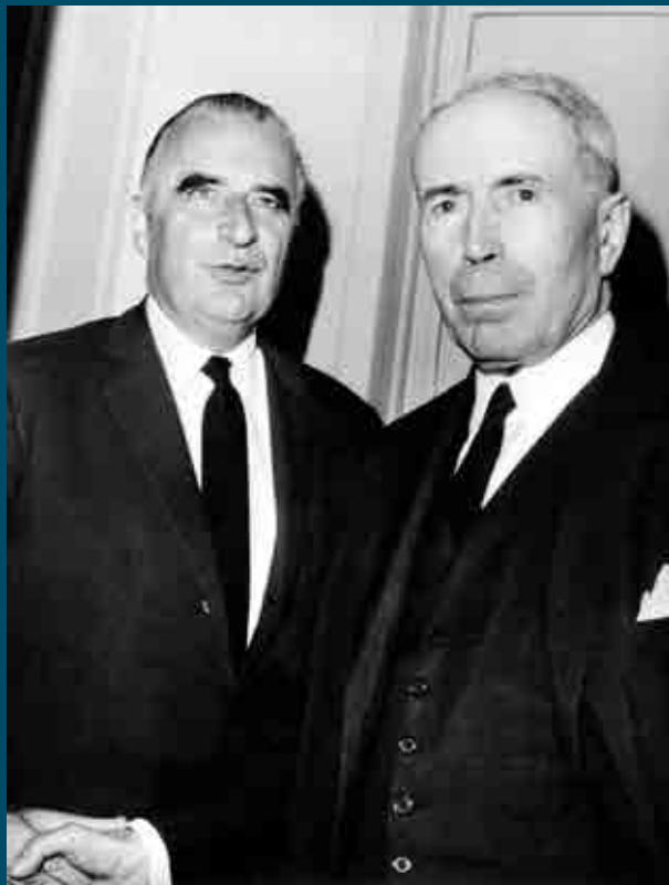
Georges-Pompidou (à gauche) et le ligérien Antoine-Pinay, ancien président du Conseil des ministres français, ancien ministre des finances, ancien président du Conseil général de la Loire, ancien maire de Saint-Chamond.