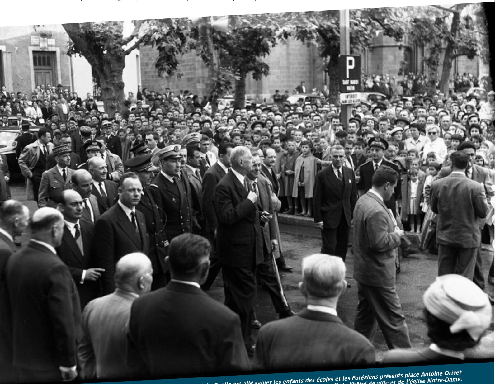
Le général-de-Gaulle est allé saluer les enfants des écoles et les Foréziens présents place Antoine Drivet mais aussi massés sur les marches du café de l'hôtel de ville et de l'église Notre-Dame. Archives municipales de Saint-Étienne - fonds Léon Leponce - 5F1_9584_0001