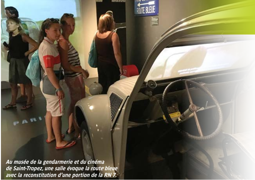
Au musée de la gendarmerie et du cinéma de Saint-Tropez, une salle évoque la route bleue avec la reconstitution d'une portion de la RN 7.