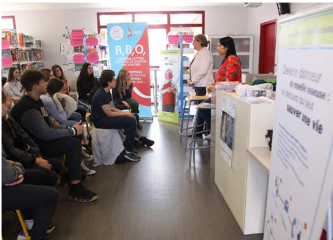
Lors de la sensibilisation au don de sang et de moelle osseuse.

route tout en leur souhaitant une grande prudence. Chaque collégien a été chaleureusement applaudi lors de la remise de son diplôme.