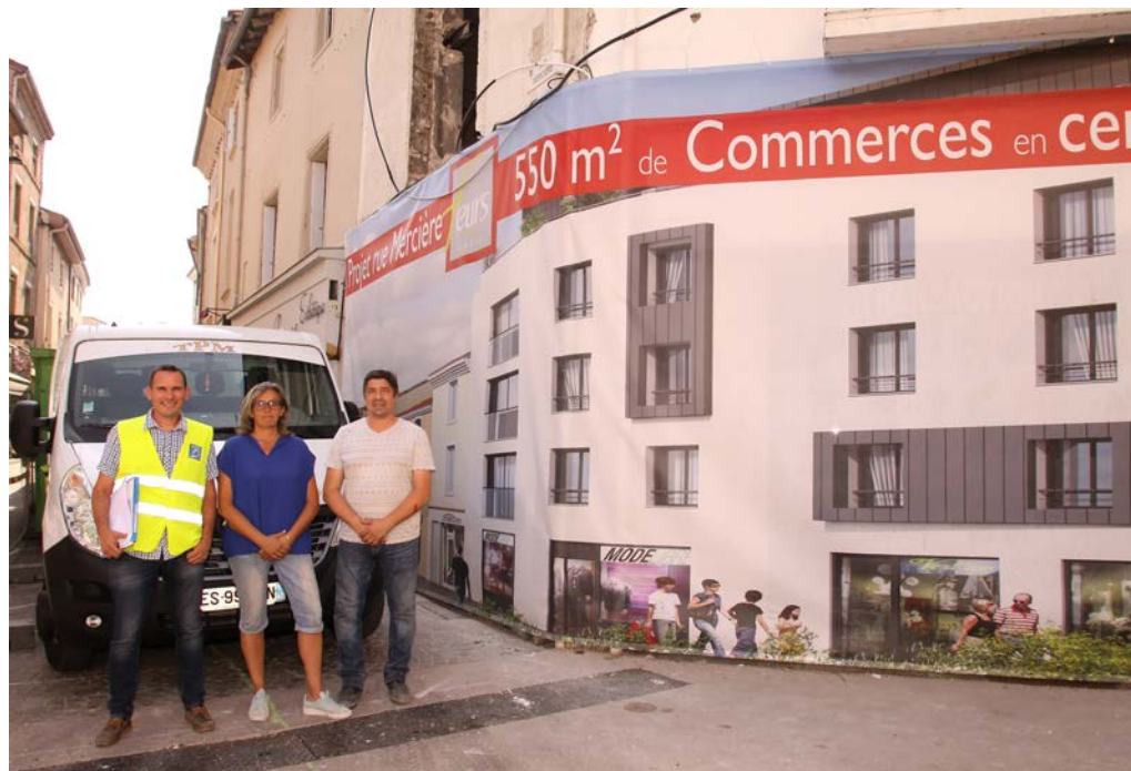
Lors d'une réunion de chantier, mi-juillet durant les phases de désamiantage et de curage intérieure.

Du mardi au vendredi, les travaux se dérouleront à l'intérieur du bâtiment. On peut considérer que la démolition de ces 750 m 2 sera achevée mi-octobre et que le chantier sera terminé avant les fêtes de fin d'année.