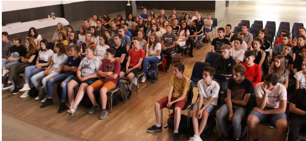
Les collégiens dans l'attente de la remise du diplôme.