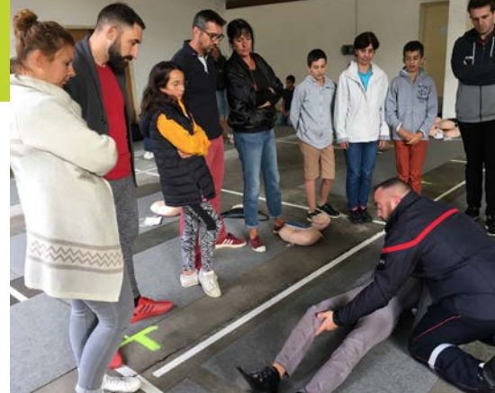
La présentation se fait par petits groupes.

A Feurs, elle se déroulera de nouveau à la caserne, 2 rue du maréchal Gallieni, de 9 heures à 11 heures.