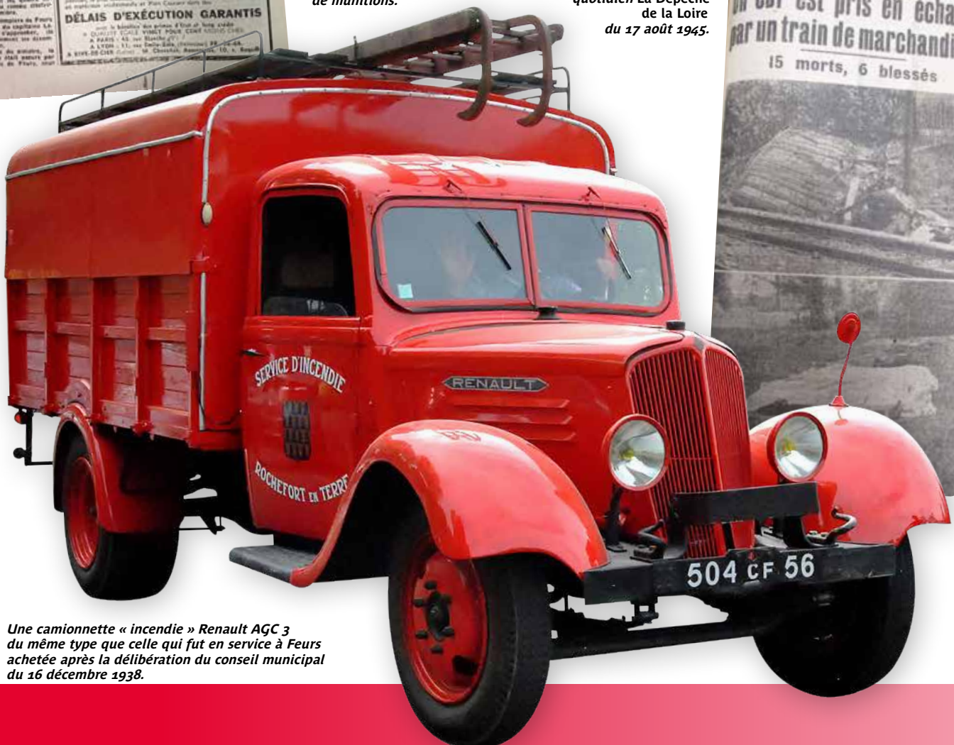
Une camionnette « incendie » Renault AGC 3 du même type que celle qui fut en service à Feurs achetée après la délibération du conseil municipal du 16 décembre 1938.