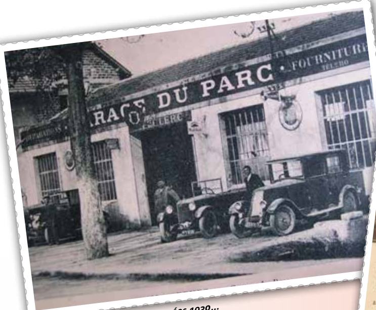
Le garage Leclerc dans les années 1930...