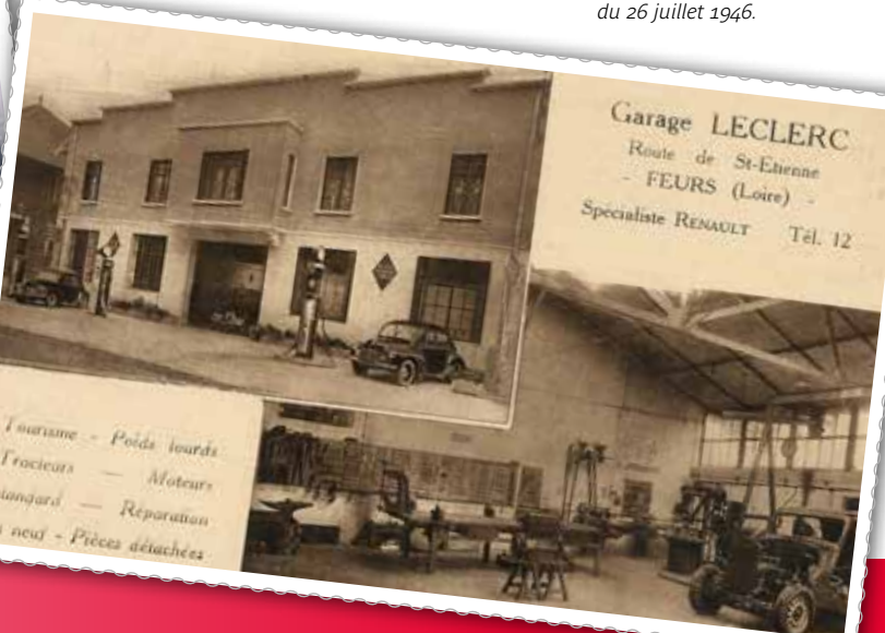
... et dans les années 1950.