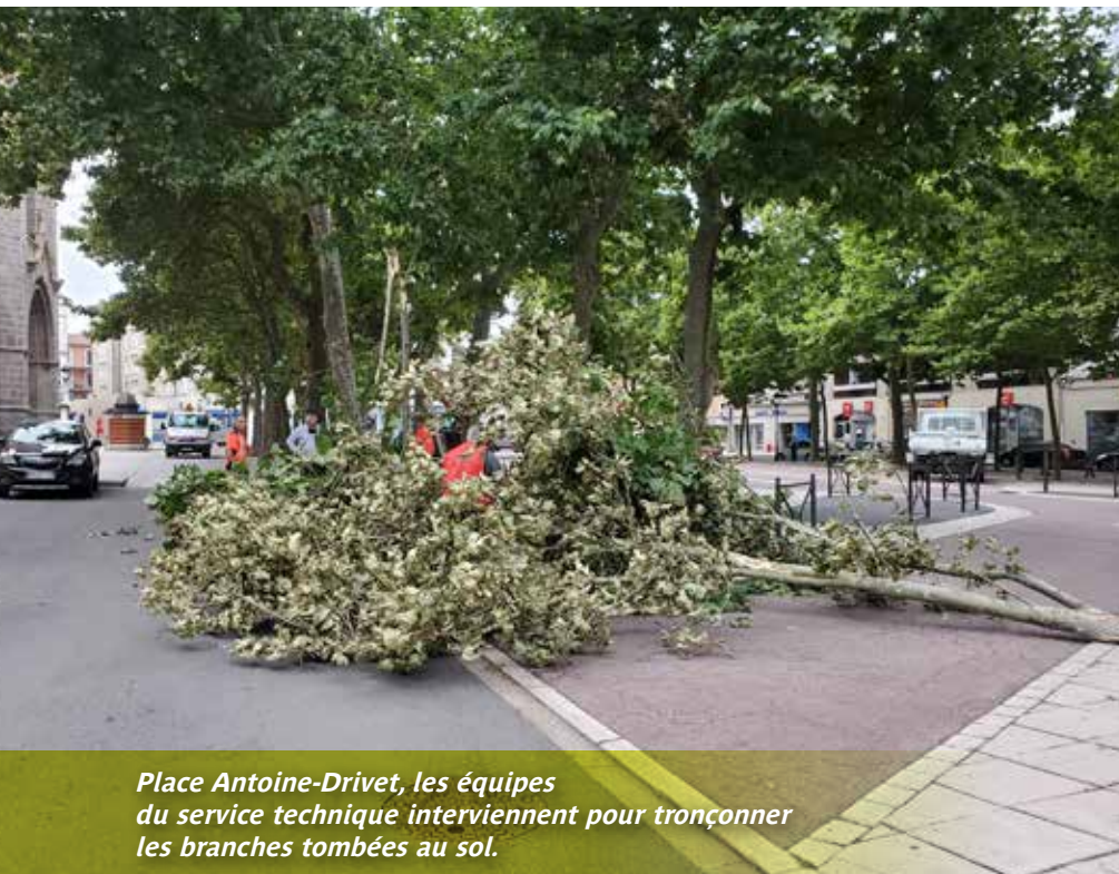
Place Antoine-Drivet, les équipes du service technique interviennent pour tronçonner les branches tombées au sol.

Jeudi 12 août, un orage s'est abattu sur Feurs faisant de nombreux dégâts nécessitant l'intervention, en urgence, de l'équipe d'astreinte du service technique.