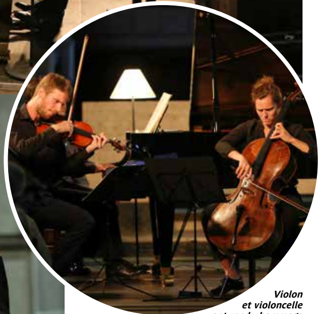
Violon et violoncelle ont rendu hommage à Beethoven.