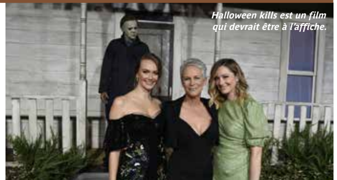
Halloween kills est un film qui devrait être à l'affiche.