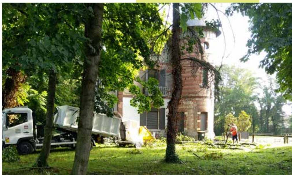
Le parc du Rozier a été touché par l'orage du 12 août.