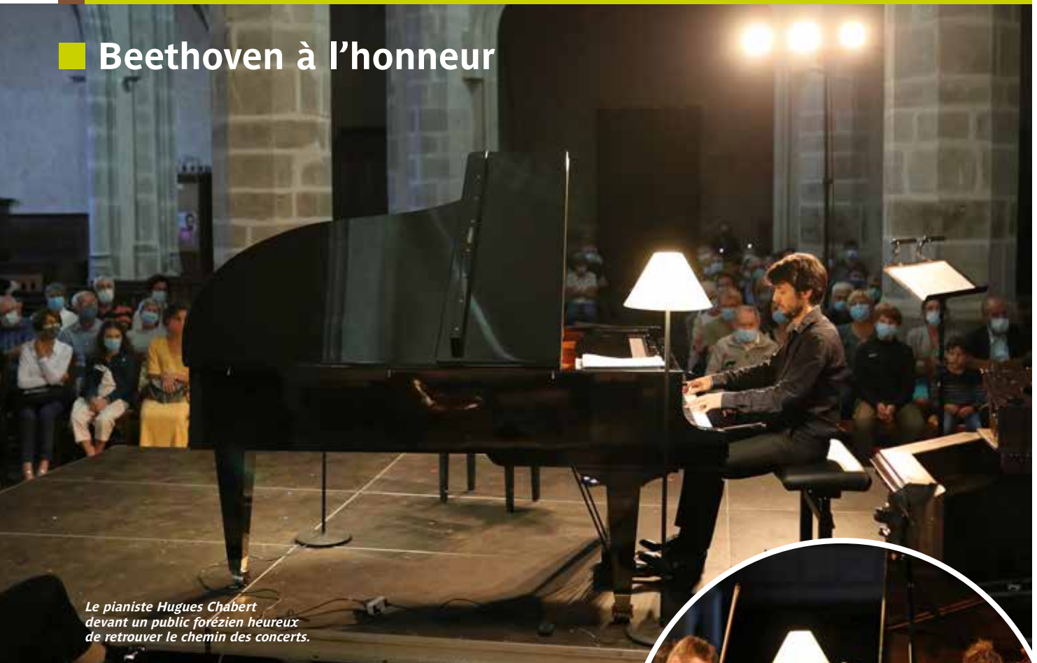
Le pianiste Hugues Chabert devant un public forézien heureux de retrouver le chemin des concerts.

Le festival des Montagnes du matin a fait halte à Feurs, cet été. Une 13 e édition attendue par les mélomanes, impatients de retrouver le chemin des concerts après une longue interruption.