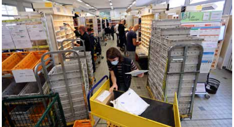
Les anciens locaux du bâtiment place de la Boaterie sont désormais vides. Cette photo appartient au passé...

C'est toujours au bureau situé place de la Boaterie, en plein cœur de Feurs, que pourront être retirés colis et recommandés si vous étiez absent après le passage du facteur à votre domicile.