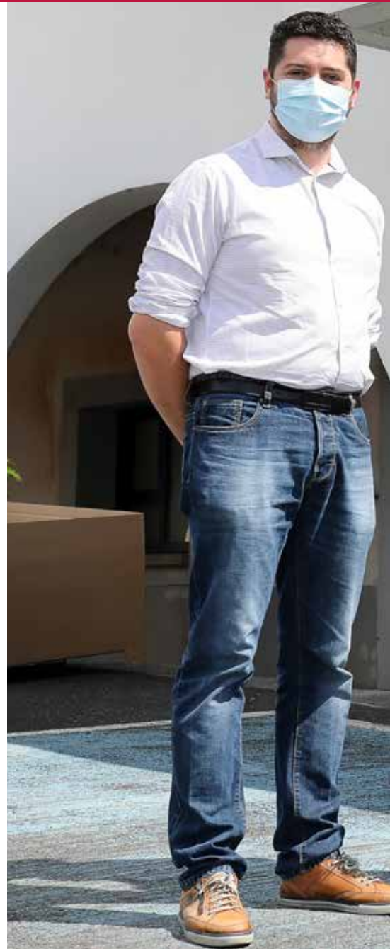
Lors d'une récente visite du chantier, au début de l'été, les docteurs

« À la place du commercial qui n'a pas marché, la municipalité forézienne a la volonté de créer du tertiaire au faubourg Saint-Antoine