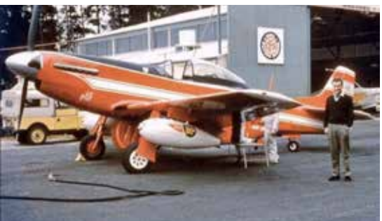
C'est peut-être avec cet avion que Ron-Flockhart s'est posé sur la piste de Feurs/Chambéon.

type D. « L'accueil était grandiose » se souvient le Forézien. C'est aussi l'occasion de parler voitures, eux qui sont passionnés et qui participent à des courses de côte. C'est ainsi qu'ils sont sollicités par l'organisation des 24 heures du Mans pour venir courir sur ce mythique circuit à l'occasion d'une prochaine épreuve, qui est l'une des trois courses les plus prestigieuses au monde. (4) Une proposition qui ne se refuse pas ! Pourtant, le duo Fraisse-Fayet ne s'inscrira pas. « Madame n'a pas voulu ... Les enfants étaient jeunes » dit-il en regardant son épouse. Et cette dernière confesse « c'est la seule fois où je lui ai dit non. » Il n'a pas pris la mouche. Et probablement – puisqu'il était très bricoleur – il s'est remis à travailler le fer forgé, une de ses passions.