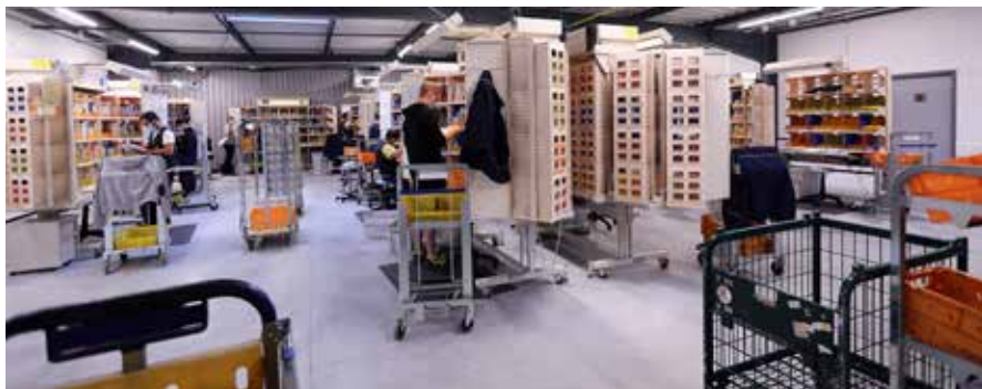
La nouvelle plateforme de distribution du courrier, rue des Vauches, fonctionne depuis début juin.

Des véhicules électriques seront prochainement déployés sur ce site afin d'assurer des tournées extérieures en respectant les normes environnementales. Des « trois roues » électriques « Staby » seront également affectés au centre de Feurs.