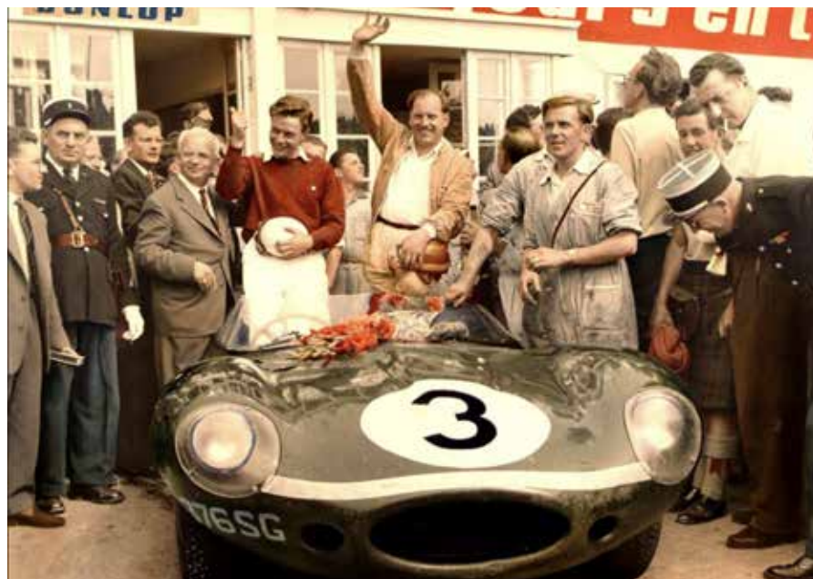
Les vainqueurs des 24 heures du Mans 1957 sur Jaguar D, Ron-Flockhart (en polot rouge) et Ivor-Bueb.