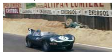
La Jaguar D en 1957, sur le circuit des 24 heures du Mans.

Bien des années plus tard, en 1991, toujours passionné par l'automobile, il organise un rallye international de vieilles voitures. Celui-ci se déroule sur quatre jours, dans le Var, avec des participants venant de Suisse, Belgique, Allemagne et Grande-Bretagne.