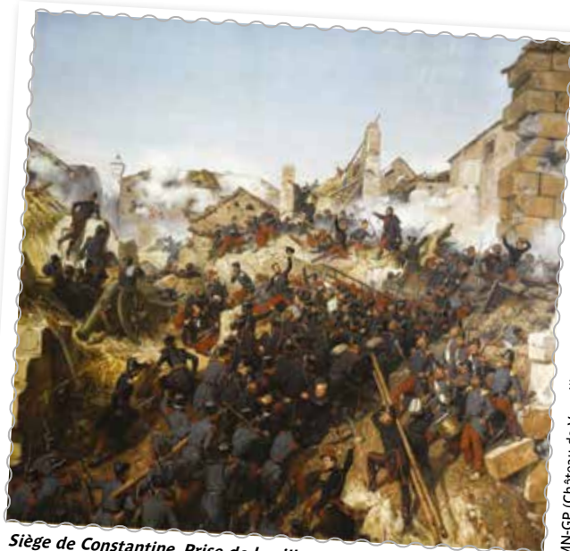
Siège de Constantine. Prise de la ville, 13 octobre 1837. Tableau d'Horace Vernet exposé au château de Versailles.

nemi, éclatait et ravageait les rangs des assaillants. Mais rien n'arrête l'ardeur du colonel, pas même une première blessure reçue au cou ; conservant, au contraire, tout son sang-froid au milieu du désordre et des ravages causés par la mine, il rallie ses braves dispersés et à moitié ensevelis sous les décombres, pénètre avec eux dans l'intérieur de la ville, débouche dans la