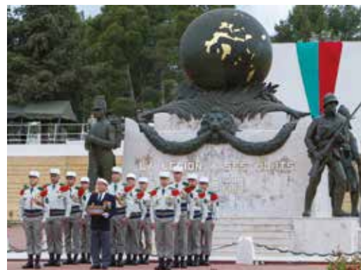
Lors de la fête de Camerone à Aubagne, en 2020.

• Le jeudi 28 avril, la circulation automobile autour de la statue du colonel Combe sera interdite et déviée le temps de la cérémonie. Le stationnement sur la place Antoine Drivet sera interdit tout le matin.