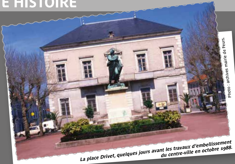
La place Drivet, quelques jours avant les travaux d'embellissement du centre-ville en octobre 1988.