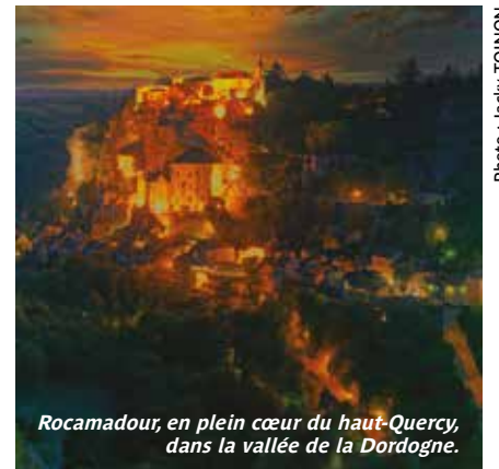
Rocamadour, en plein cœur du haut-Quercy, dans la vallée de la Dordogne.

• Mercredi 13 avril, 20 h 15, théâtre du forum. Entrée gratuite.