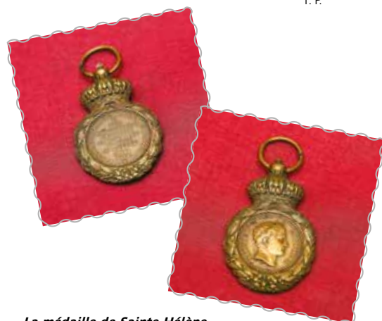
La médaille de Sainte-Hélène.