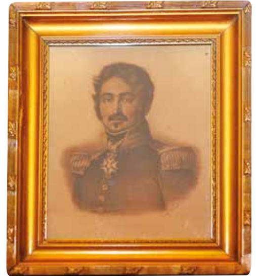
Portrait du colonel Michel-Combe.

Le 3 avril 1814, jour où le Sénat vote la déchéance de l'empereur, il revient auprès de Napoléon comme capitaine au 1 er régiment de grenadiers de la vieille garde. Michel Combe va alors suivre l'empereur à l'île d'Elbe comme officier du bataillon de Napoléon. Le 26 février 1815, il est aux côtés de Napoléon et participe à la campagne de France. Le 18 juin 1815, il se trouve à Waterloo dans les derniers carrés de la Garde. Auguste Broutin écrit : « Michel Combe, à la tête de son régiment de la garde impériale, fit des prodiges de valeur et répéta trois fois avec ceux qui l'entouraient : La garde meurt et ne se rend pas. Il fal-