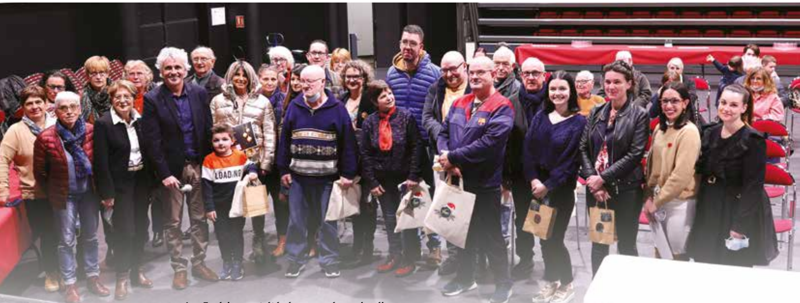
Les Foréziens ont été récompensés par les élus suite au concours des maisons illuminées.