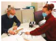
Urbanisme : le e-permis