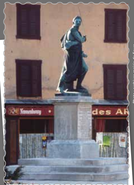
En novembre 1988, la statue du colonel Combe est positionnée au milieu du rond-point, au départ de la rue de la Loire.