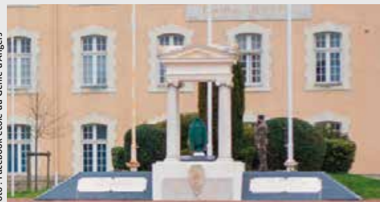
Le tombeau des Braves à Angers