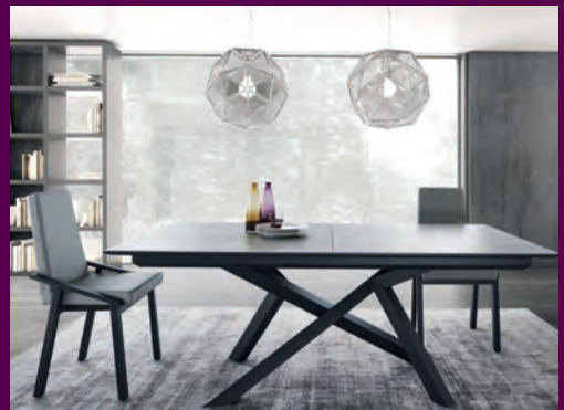
SÉJOURS, SALONS, LITERIE...