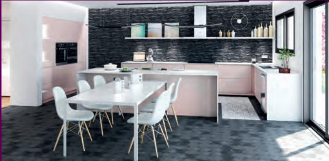
CUISINES, BAINS, DRESSINGS