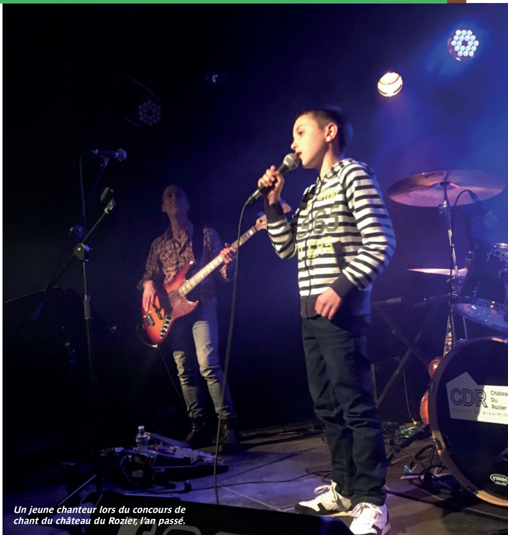
Un jeune chanteur lors du concours de chant du château du Rozier, l'an passé.