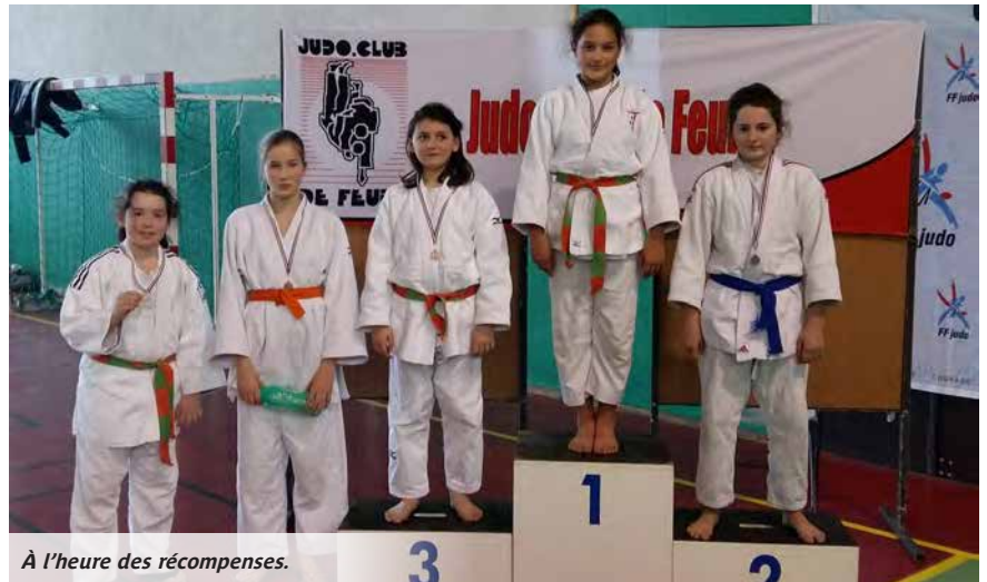
À l'heure des récompenses.

Qu'ils étaient heureux les cinquante bénévoles du Judo-club de Feurs lors du rassemblement départemental des jeunes judokas ligériens. Heureux car la journée s'est fort bien déroulée en présence des membres de la FFJDA (fédération française de judo et disciplines associées) et des représentants du conseil municipal. Près de 400 jeunes, âgés de quatre à douze ans