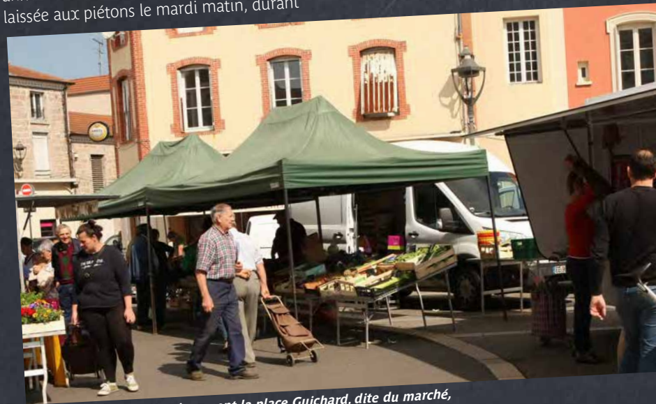
Le marché occupe historiquement la place Guichard, dite du marché, en plein cœur du quartier « lapin ».