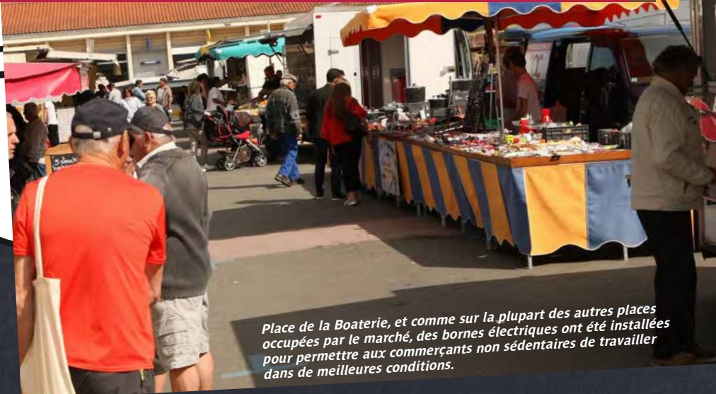
Place de la Boaterie, et comme sur la plupart des autres places occupées par le marché, des bornes électriques ont été installées pour permettre aux commerçants non sédentaires de travailler dans de meilleures conditions.

10 juillet au mardi 28 août. Les horaires de vente sont, pour l'été, fixés de 7 h 30 à 13 heures.