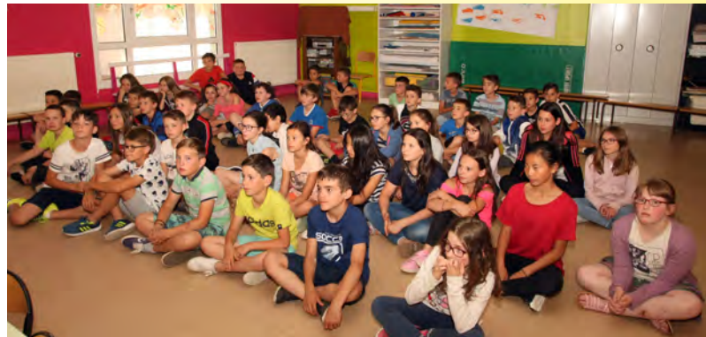
À l'école Saint-Marcellin-Champagnat.