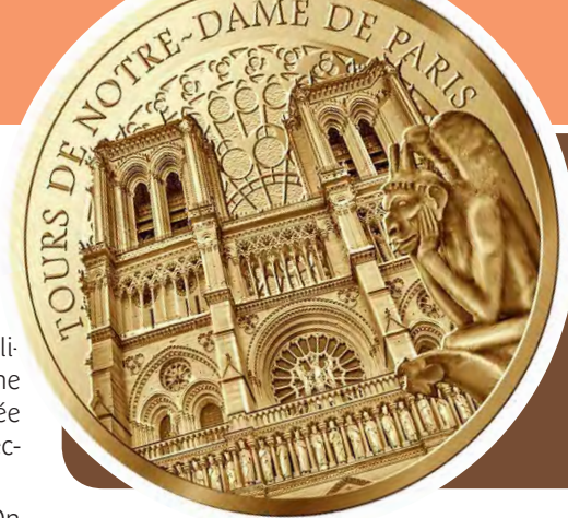
Jeton touristique de la Monnaie de Paris consacré à Notre-Dame de Paris.

• Dimanche 30 septembre, 9 h 30 à 18 heures, salle des fêtes Eden. Entrée gratuite.