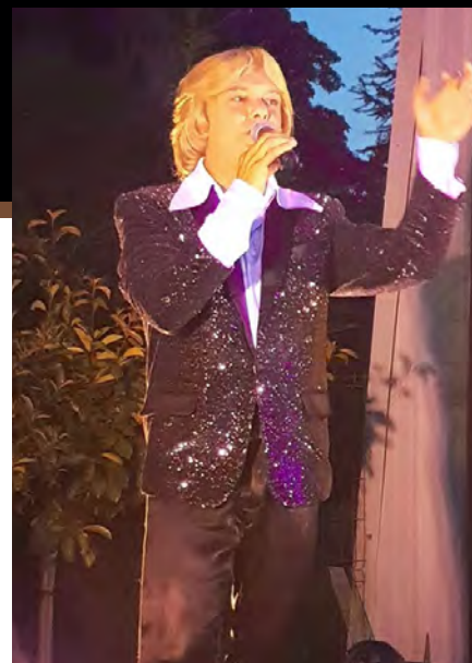
Samedi soir, les Foréziens assisteront à un grand spectacle spécial Claude-François.