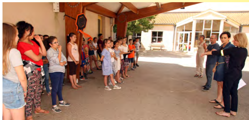
À l'école du 8 mai.

Après une pause durant la période estivale, l'animation (A)musée-vous ! est de nouveau au programme des animations du musée d'Archéologie en cette rentrée de septembre 2018. Ce sera le mercredi 19, de 15 heures à 16 h 30. Les enfants âgés de six ans et plus sont concernés et peuvent participer à l'atelier de peinture rupestre. Les inscriptions sont obligatoires (3,70 euros/enfants) auparavant.