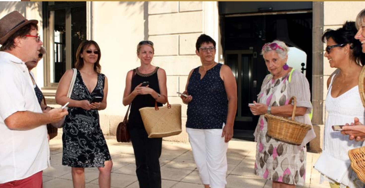
Bénévolement, les comédiens de la compagnie Les Pas Sages ont animé les marchés d'été de Feurs, le mardi.