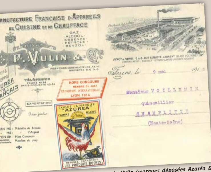
Sur la lettre des établissements Vulin (marques déposées Azurée & Français) le rajout d'un « timbre » tricolore indique clairement la couleur !

Rue de la République, lorsqu'ils le peuvent, les Foréziens viennent « Au grand jardin d'Espagne & du midi » chez Gabriel-Réus. On y trouve notamment des primeurs mais aussi des oranges, mandarines, citrons et grenades.