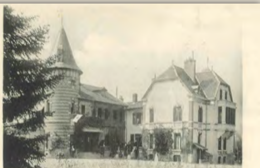
Feurs - Château du Rozier, occupé par une ambulance pendant la Guerre 1914-1918

Le château du Rozier, occupé par une ambulance pendant la Guerre 1914-1915 est la légende de la carte postale éditée par la maison Golzio.