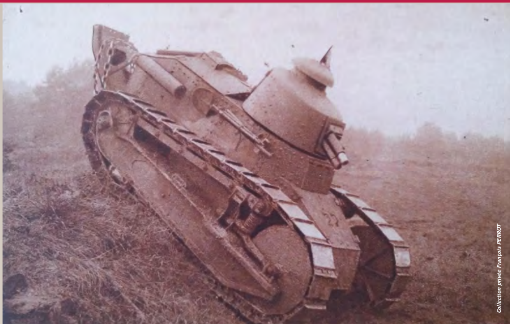
Un char de combat Renault T 17

Pierre-Louis-Mollon a été un des rescapés de ces interminables batailles. Si le temps efface certaines images, si le temps altère certains souvenirs, d'autres, en revanche, sont indélébilement conservés dans la mémoire. Des