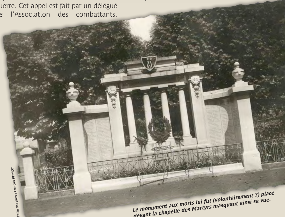
Le monument aux morts lui fut (volontairement ?) placé devant la chapelle des Martyrs masquant ainsi sa vue.

• (1) Le monument aux morts de Feurs par Paul Valette, Cahiers de Village de Forez, 2011.