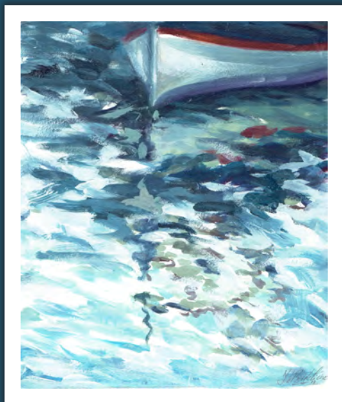
Une œuvre de l'artiste : monotype barque.

• Du 29 novembre au 13 décembre, patio de la maison de la commune. Entrée libre