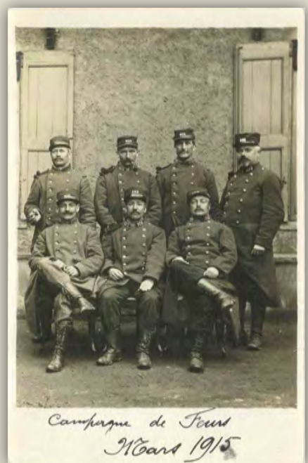
Des militaires du 102 e territorial en poste à Feurs en mars 1915.

Dans le cas de la première guerre mondiale, trois armistices ont été signés. Le premier, celui du 11 novembre pour une durée de trente-six jours. Il sera renouvelé trois fois, le 12 décembre 1918 et le 16 janvier 1919, pour une durée illimitée. Ce n'est que le 28 juillet 1919 que sera signé le traité de Versailles.