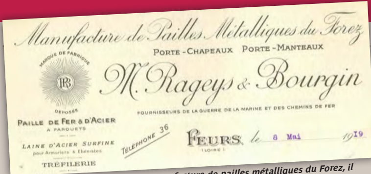
Sur ce document de 1919 de la manufacture de pailles métalliques du Forez, il a été rajouté « fournisseurs de la guerre de la marine et des chemins de fer ».

Le 11 novembre, dans la brume du petit matin dans la clairière de Rethondes en forêt de Compiègne, est immobilisé un wagon. Il provient du train d'État-major du maréchal Foch. Vers 5 h 15, les plénipotentiaires français, anglais et allemands signent l'armistice annonçant le cessez le feu pour 11 heures.