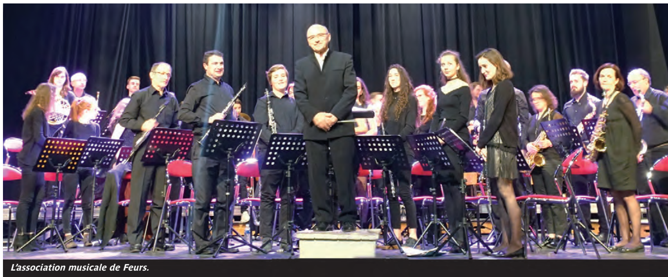
L'association musicale de Feurs.

Deux orchestres d'harmonie se rassemblent pour une cause généreuse, participer à la collecte de fonds pour l'association « Le chemin de Lola ». Ce sera le dimanche 18 novembre, au théâtre du forum, à la maison de la commune. Les deux phalanges musicales sont réputées dans la région puisqu'il s'agit de l'harmonie