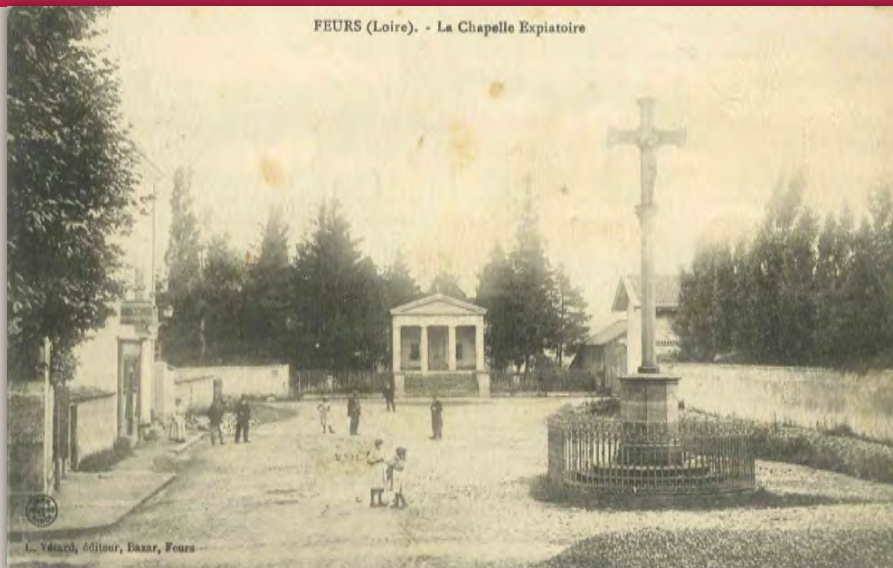
La croix de Mission érigée en 1864 ne se trouvait pas dans l'axe de la chapelle des Martyrs. Elle a été réédifiée en 1929 au nouveau cimetière.

Tout d'abord une cérémonie religieuse précéda la cérémonie civile qui se déroula huit jours plus tard. Sur un document signé par le curé Unal il est écrit : « Dimanche 3 novembre à 10 heures, un service solennel sera célébré à la mémoire de nos SOLDATS morts au Champ d'Honneur... La GRANDE NEF sera réservée aux HOMMES. Une QUÊTE sera faite pour les réparations de la CHAPELLE des MARTYRS. Après la messe les GROUPEMENTS présents sont invités à prendre place dans le CORTÈGE pour se rendre au MONUMENT aux MORTS