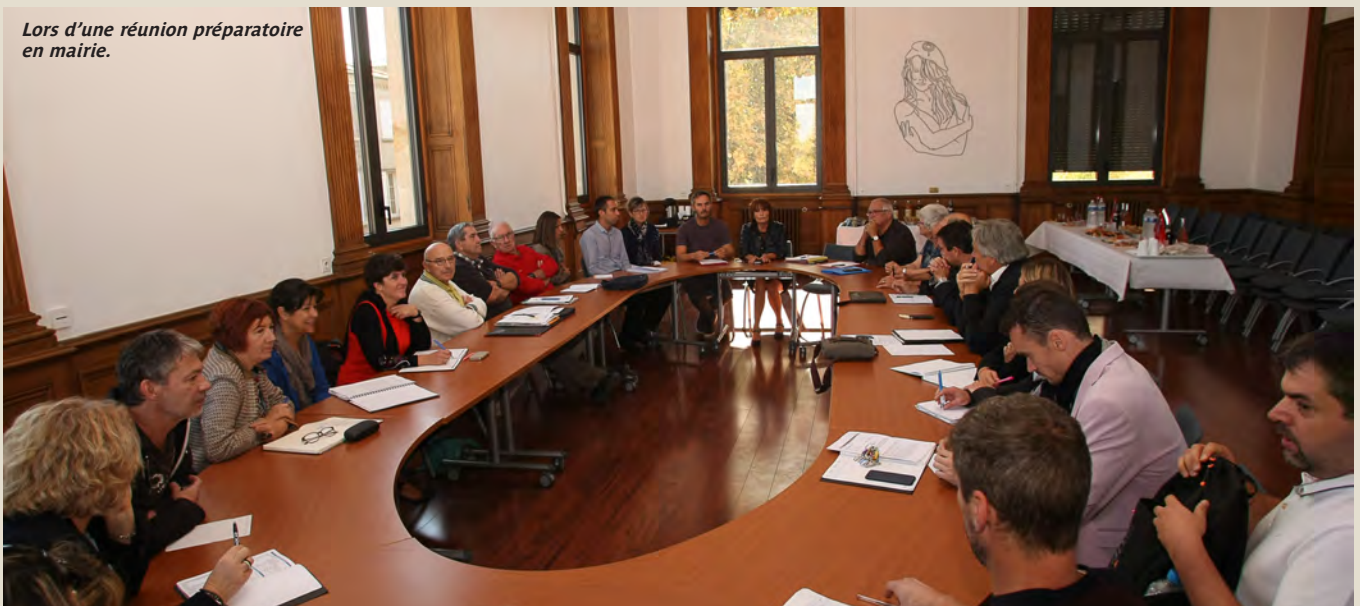
Lors d'une réunion préparatoire en mairie.