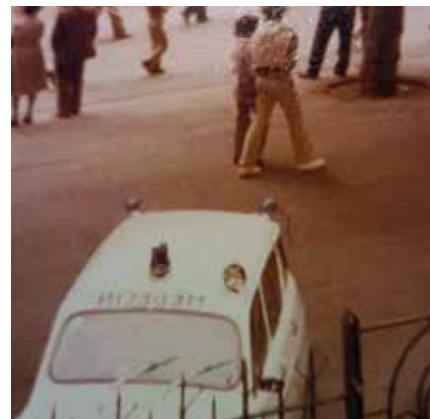
La Renault 4 L du SMUR de Feurs, en juin 1979.