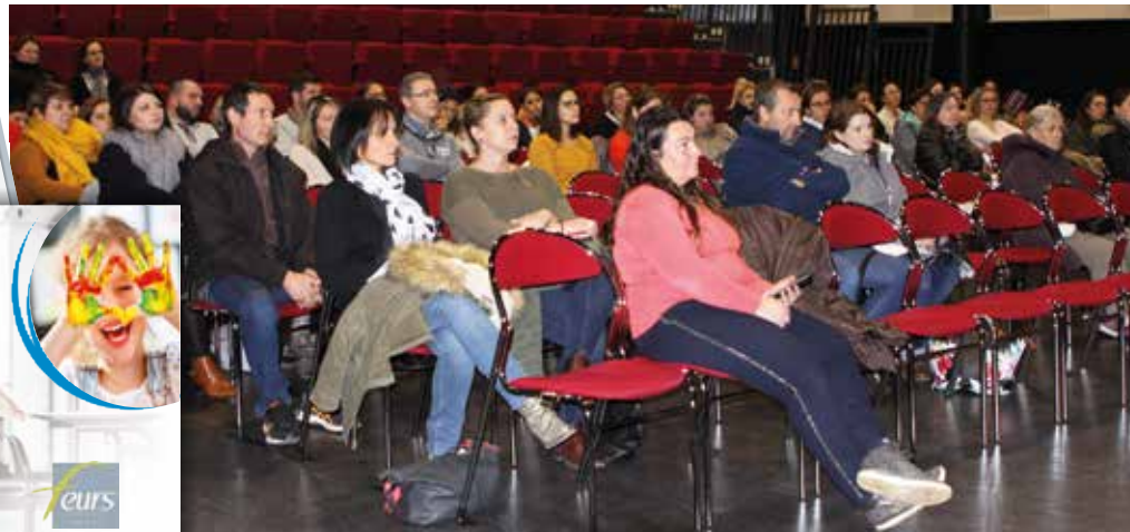
Tous les parents concernés ont été invités à participer à la réunion publique afin de découvrir le fonctionnement du logiciel et de poser les questions nécessaires.

Les parents qui ont encore des tickets ont jusqu'au 4 janvier pour les ramener en mairie afin de les faire créditer sur leur compte, une fois bien naturellement après qu'ils aient créés leur compte.