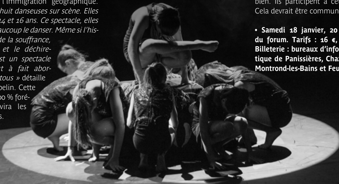
Les danseuses de « Danse et compagnies ».

• Samedi 18 janvier, 20 h 30, théâtre du forum. Tarifs : 16 €, réduit : 14 €. Billetterie : bureaux d'information touristique de Panissières, Chazelles-sur-Lyon, Montrond-les-Bains et Feurs.