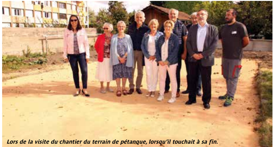
Lors de la visite du chantier du terrain de pétanque, lorsqu'il touchait à sa fin.