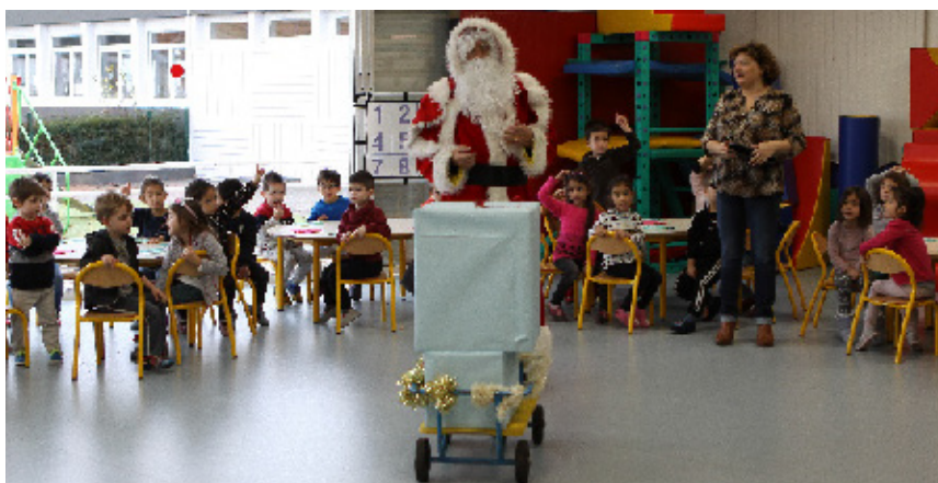
À l'école maternelle Charles-Perrault.