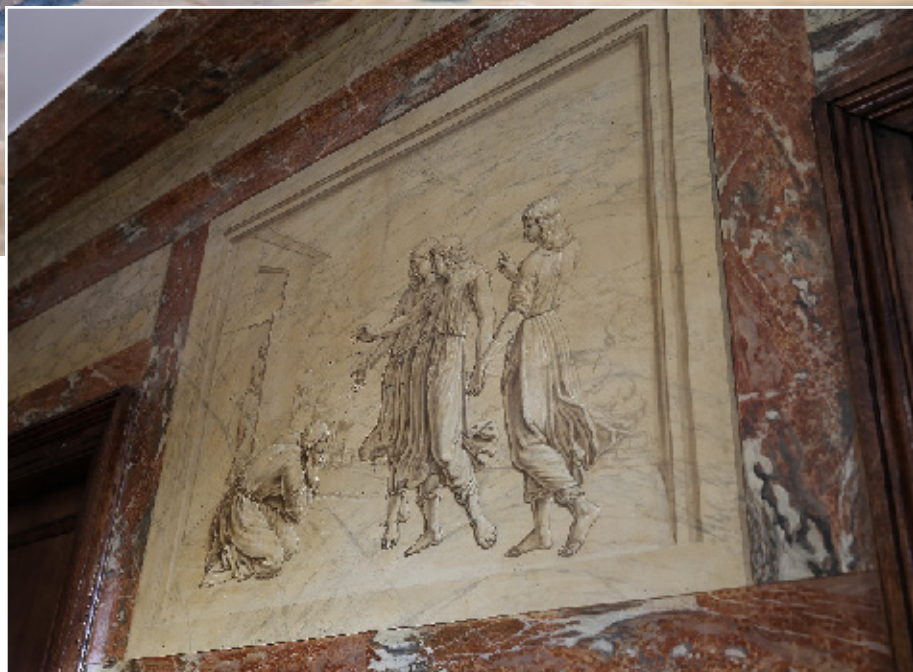
Dès que l'on entre dans le musée, on découvre les œuvres de Zaccheo.