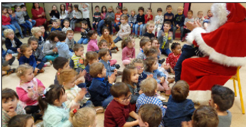
À l'école maternelle Saint-Marcellin-Champagnat.