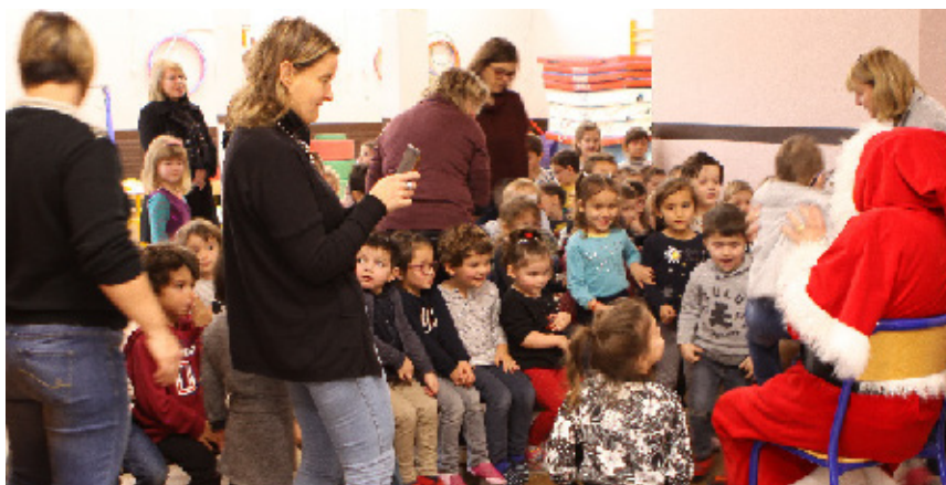
À l'école maternelle du 8-Mai.